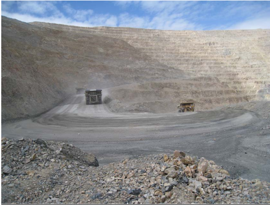
Barricks Pipeline Mine in Nevada