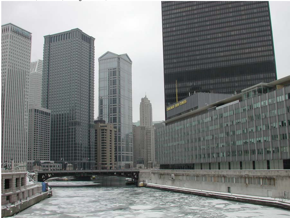
Eiskalt erwischt: Das Derivate-Mekka Chicago.

gen, Family Offices und Versicherungen, die Rohstoffe allesamt relativ spät entdeckten und massiv über unterschiedlichen Investmentformen (wie Zertifikate, Swaps, Indexfonds und strukturierte Produkte) in diese Anlageklasse investierten. Zahlen der Bank für Internationalen Zahlungsausgleich (BIZ) zeigen die enormen Kapitalzuflüsse von Akteuren der Finanzbranche. Das Nominalvolumen von im Freiverkehr (OTC) gehandelten Rohstoff-Derivaten (in der Regel sind das Rohstoff-Swaps) ist einer Untersuchung der BIZ zufolge im Zeitraum von 2001 bis zum dritten Quartal 2008 von etwa 0,25 auf rund 13 Billionen US-Dollar in die Höhe geschossen. Das entspricht in etwa einer Verfünzigfachung des Wertes.